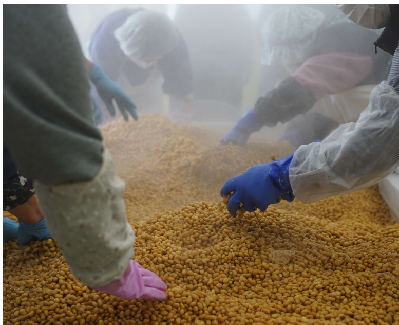
蒸したての大豆をかき混ぜて粗熱を取る参加者

法を元としています。通常1対1の割合で仕込む大豆と米を、生大豆1に対して生米1・5の量で仕込むため、麴歩合が高くなるやかで甘味があるのが特徴です。参加者は持参したバケツいっぱい到手づくりで味噌をこね、笑顔で作業されていました。