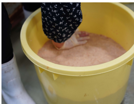
バケツいっぱい味噌づめ

光熱費、原材料費等の高騰により、誠に勝手ながら4月1日より一部手まめ館商品価格の改定をさせていただきます。改定後価格は1・2年味噌680円、3年味噌630円、ざる豆腐230円、納豆80円、豆菓子240円、きな粉小280円（きな粉大は据え置き）、油揚げ3枚から2枚へ変更し120円。そのほかは店頭にてご確認ください。何卒、ご理解の程よろしくお願い申し上げます。