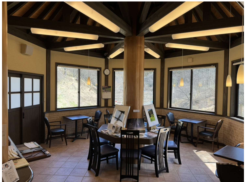
開所日：火・金・日 10時～16時 利用料：無料